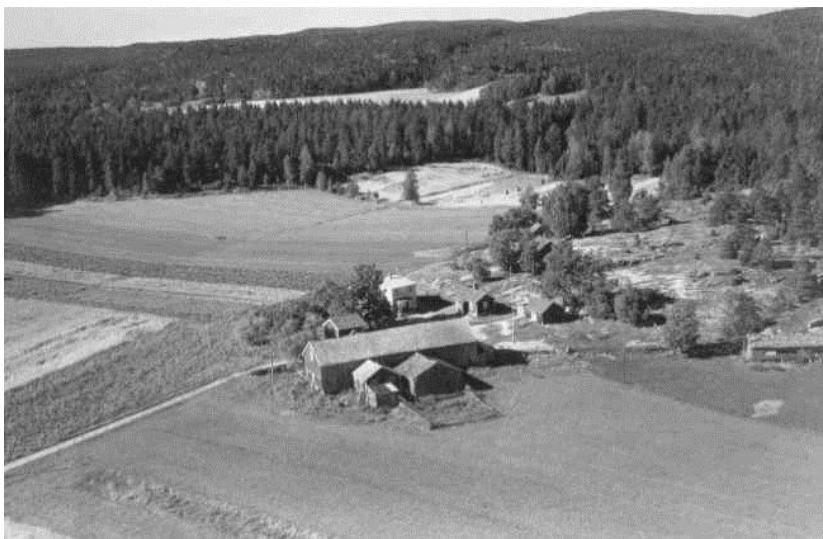
Røed gård, 1951

dens eiere og beboere fra vikingetid og frem til i dag